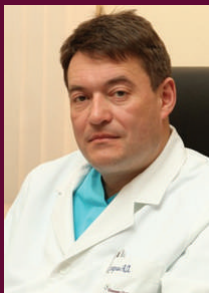
Каприн А.Д. член-корреспондент РАН, д.м.н., профес- сор, директор ФГБУ «Национальный медицинский исследо- вательский радиологи- ческий центр» Минздрава России, главный уролог АН РФ