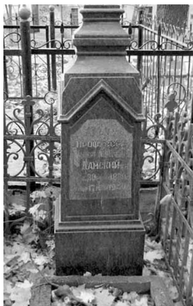
Рис. 6. Могила профессора А.Я. Дамского в Смоленске Fig. 6. Grave of Professor A.Ya. Damsky in Smolensk

Личность профессора А.Я. Дамского как ученого была сформирована из элементов, нередко присущих и другим ученым, но в нем эти качества были «сцементированы» редкими личными особенностями оригинального и глубокого мыслителя, блестящего полемиста и талантливого