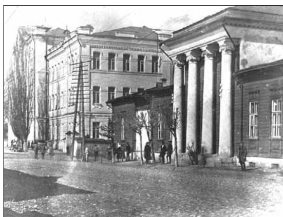
Рис. 2. Смоленский медицинский институт в 1920–1930-е гг.

Fig. 1. Professor A.Ya. Damsky (1868–1949)