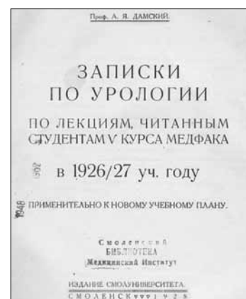
Рис. 3. Сборник лекций для студентов профессора А.Я. Дамского «Записки по урологии»

Fig. 2. Smolensk State Medical University in the 1920–1930