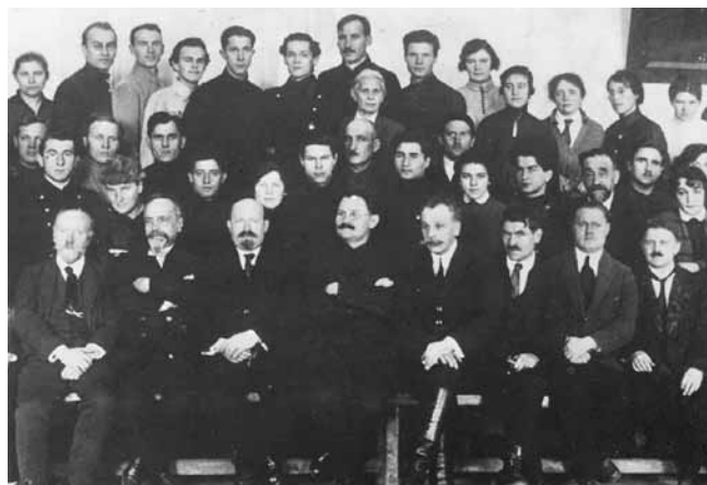
Рис. 5. Сотрудники кафедры урологии Смоленского медицинского института вместе с профессором А.Я. Дамским Fig. 5. Employees of the urology department of Smolensk State Medical University together with Professor A.Ya. Damsky

тельный метод при различных хирургических заболеваниях почек и мочевых путей» («Врачебная газета», 1905), «Новый операционный цистоскоп автора» (Труды Петербургского урологического общества, 1913) [4], «Трансвезикальная простатэктомия на основании 60 собственных наблюдений» (Труды I Всероссийского съезда урологов, 1925) [5]. А.Я. Дамский рецензировал монографию Л.И. Дунаевского «Гипертрофия простаты» и учебник Р.М. Фронштейна «Оперативная урология» [6].