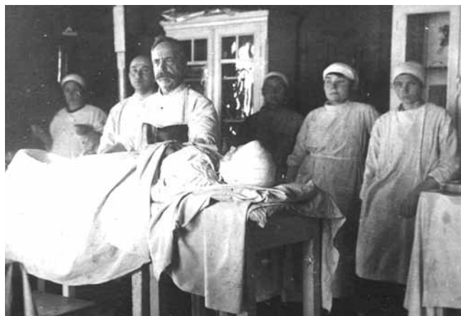
Рис. 4. Профессор А.Я. Дамский в перевязочной Fig. 4. Professor A.Ya. Damsky in the surgical dressing room