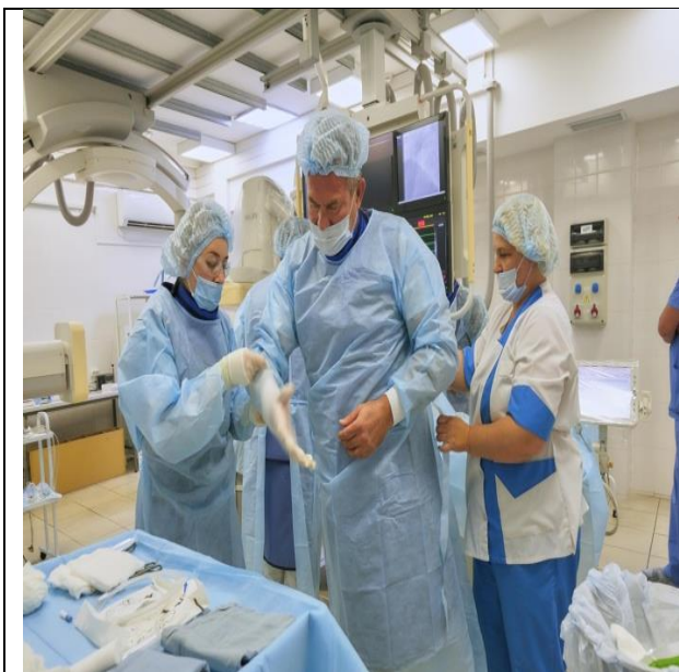
Подготовка к операции