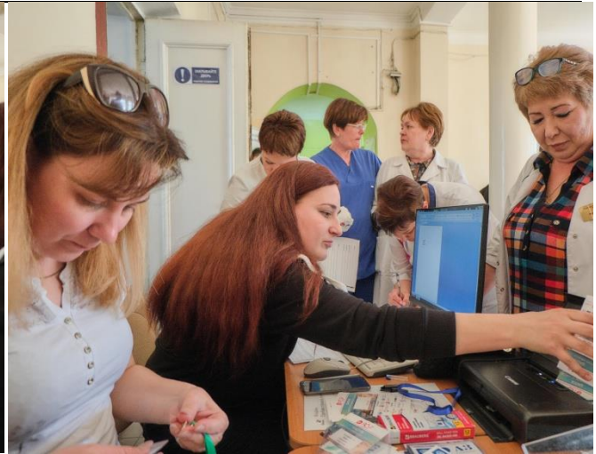
Выдача материалов конференции

На церемонии торжественного открытия Школы было предоставлено слово организаторам конференции.