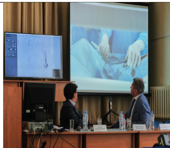
Интерактивная двусторонняя связь аудитории и операционной

В связи с быстрым ростом миомы за последние 6 месяцев и рецидивирующие кровотечения, приводящим к анемизации, пациентке выполнена двусторонняя эмболизация маточных артерий, в качестве эмболизирующего материала использованы эмбозины средней величины 500 нм. При выполнении операции возникла дискуссия по методике выполнения эмболизации с сохранением яичниковых артерий, ее селективности и прогностических критериев успеха с участием ведущих эндоваскулярных хирургов школы.