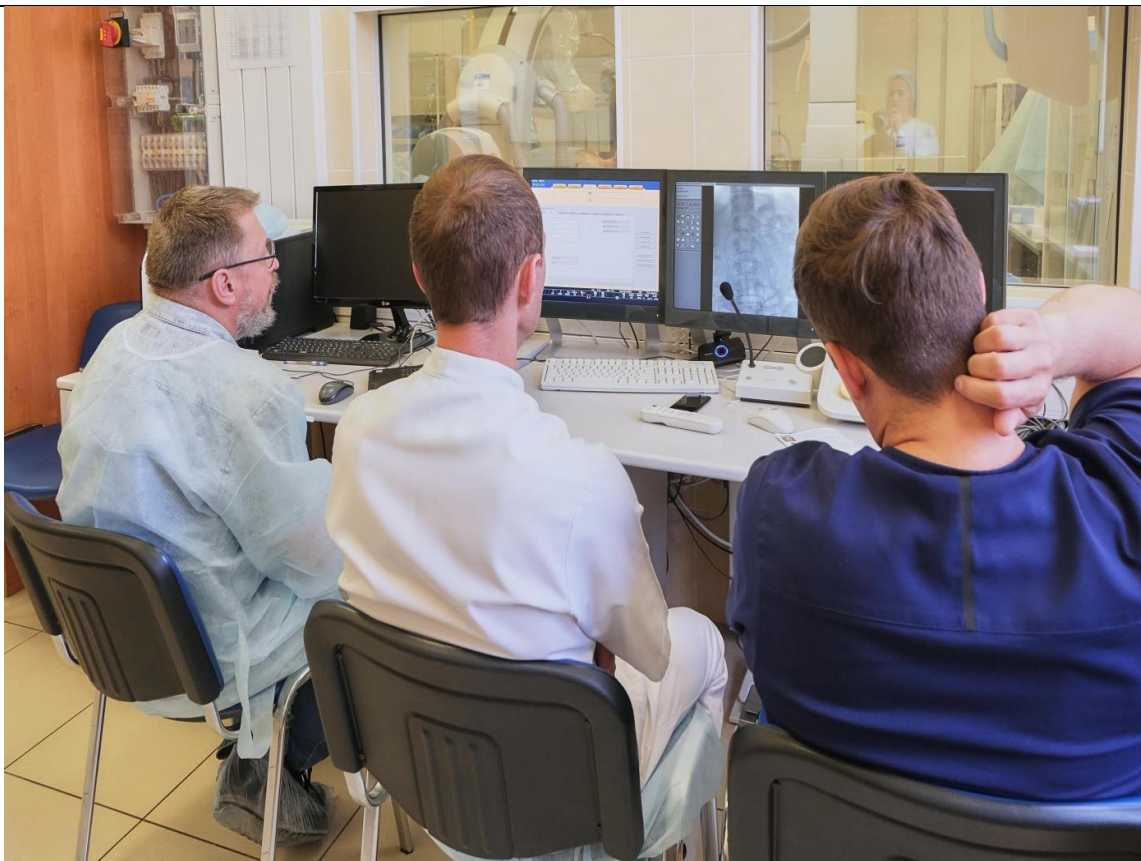
Группы АТ технологий 1 ГКБ

Возникшие нестандартные интраоперационные ситуации обсуждались совместно с специалистами регионального сосудистого центра 1КГБ, когда для принятия решения требовался профессиональный опыт и возможности экспертного ангиографического оборудования.